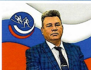
МУСТАФИН ЛИНАР МУХАМЕТОВИЧ Генеральный секретарь ФПЛД России Мастер спорта СССР по лыжному двоеборью Отличник физической культуры и спорта