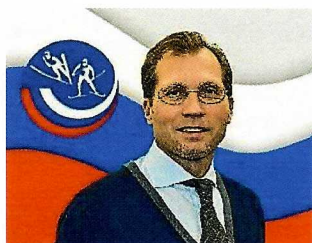
ДУБРОВСКИЙ ДМИТРИЙ ЭДУАРДОВИЧ Президент ФПЛД России Мастер спорта по лыжному двоеборью Член Исполкома Олимпийского комитета России